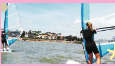
planche à voile stages dès 12 ans