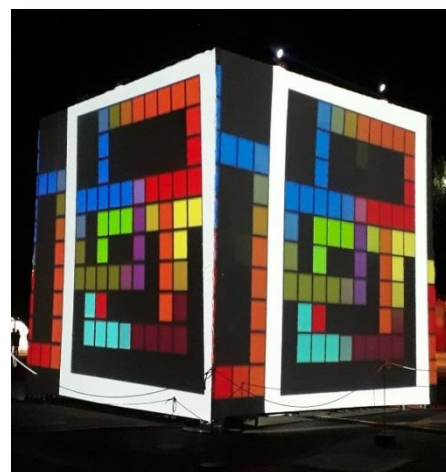
2018 : Le Cube