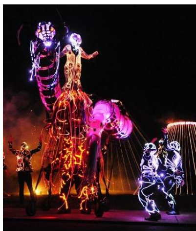
2015 : Dragon times Cie Elixir

Cet événement propose depuis sa création une programmation artistique innovante, à la croisée des arts de la rue , grandes déambulations , spectacles pyrotechniques et projets surdimensionnés .