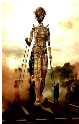
2016 : Cie l'homme debout