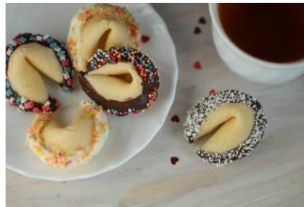
Biscuits de la chance